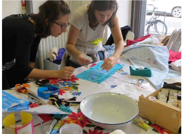
Exemple de repair café organisé par FNE Midi-Pyrénées (Sacàvrac)

Dans le cas présent, les participants pourront effectuer des réparations sur leurs vélos en échangeant leurs connaissances techniques sur le sujet, le tout dans une ambiance conviviale avec à leur disposition un lieu et du matériel adaptés.